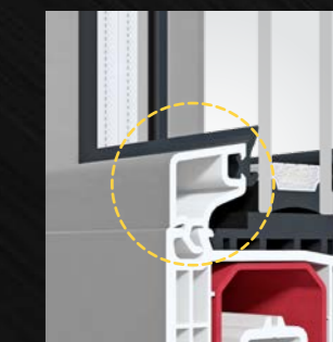
LISTELLO FERMAVETRO SQUADRATO